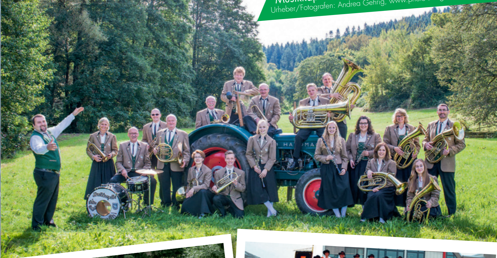
Musikkapelle Kleiner Odenwald Allemühl e.V.