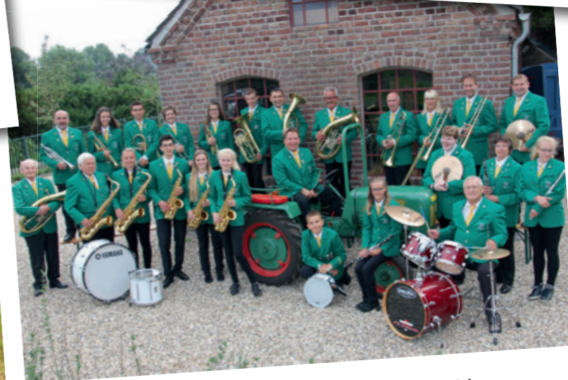
Musikverein Menzelen 1959 e.V.