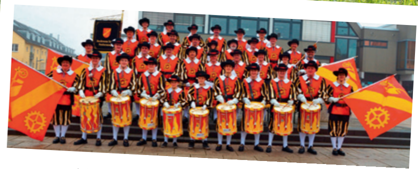
Musikverein Tamm e.V. -Fanfarenzug-