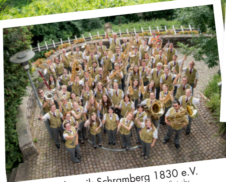
Stadtmusik Schramberg 1830 e.V.