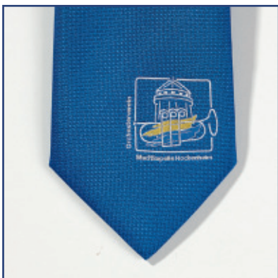
Krawatten mit eingewobenem Logo (ab 50 Stück)