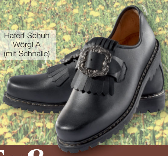
Haferl-Schuh Wörgl A (mit Schnalle)

Kniebundhosen in Damen-, Herren- und Kindergrößen als ständiges Lagerangebot in schwarzer, elastischer Helanca-Qualität. Farbe der Verschnürungen in schwarz, weiß, rot, blau, grün, gelb. Weitere Infos unter: http://eshop.fischerkleidung.de