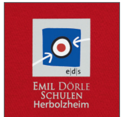
Schulmode mit Druck- oder Sticklogo