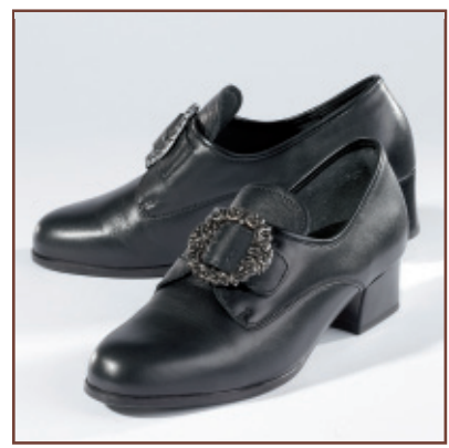
Damenschuh Liberty 55010 (30 mm Absatz)