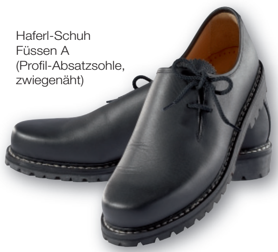
Haferl-Schuh Füssen A (Profil-Absatzsohle, zwiegenäht)