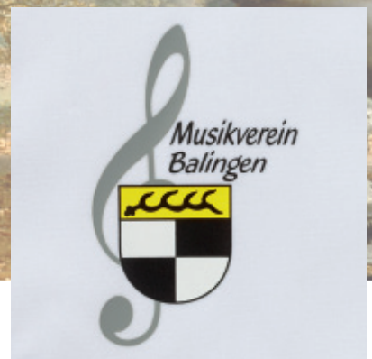
Drucklogo für Hemdenbrusttasche