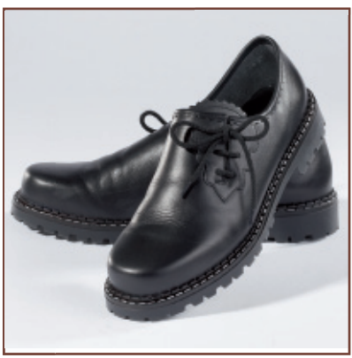
Foulard (Soft Damen-Haferlschuh)