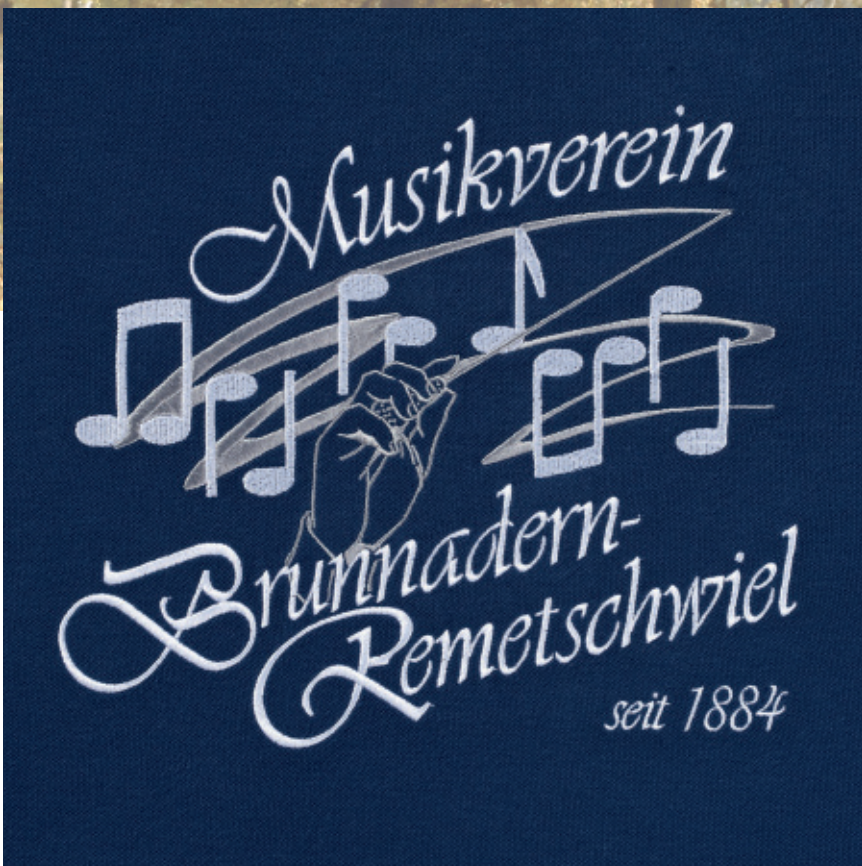
großflächige Rückenstickerei auf Poloshirt