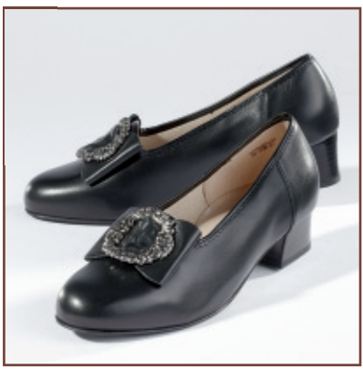
Damenschuh Liberty 55020

Damenschuhe in Soft-Ausführung mit einem angenehmen Fußbett.